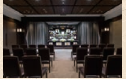
副本堂では一般的なご葬儀を