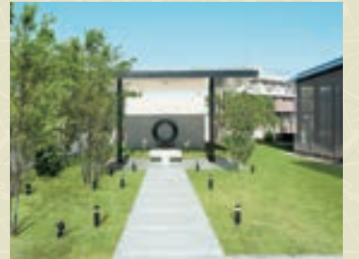
屋上庭園にある合祀納骨堂