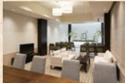
ご家族のみでのご葬儀も行えます