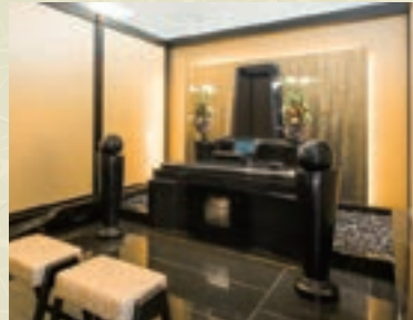
個室でお参りできる特別室 (天光・天空)