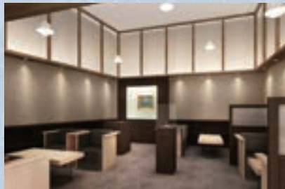
特別室専用ラウンジ