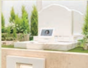
緑溢れる洋型ガーデン区画