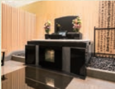
広々とした趣ある和型デザイン区画