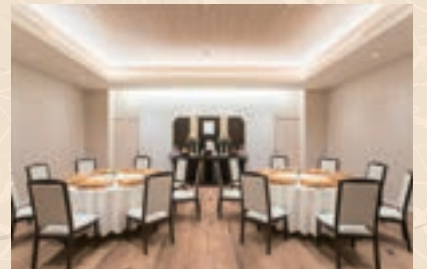
法事室では本格精進料理をご提供