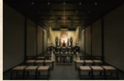
厳かな雰囲気の本堂

四十九日や一周忌、三回忌などの回忌法要と、後席の会食まで行えます。法事室では焼香が行え、焼骨、遺影写真も持ち込めます。